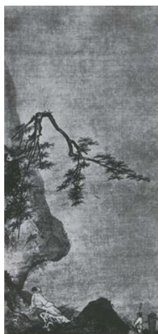
Ма Юань. Лунный свет. Живопись тушью на шелке. XII-XIII вв.