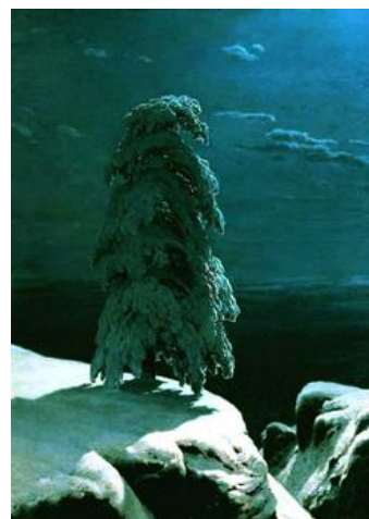
Иван Шишкин. На Севере диком..., 1891.

Творческая составляющая задания может быть усложнена предложением составить словесное описание замысла пейзажа – как заказа художнику, указав желаемую композицию, ракурс, характерные черты изображаемого и способы их достижения.