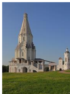
3. Церковь Вознесения Господня в Коломенском (Москва)